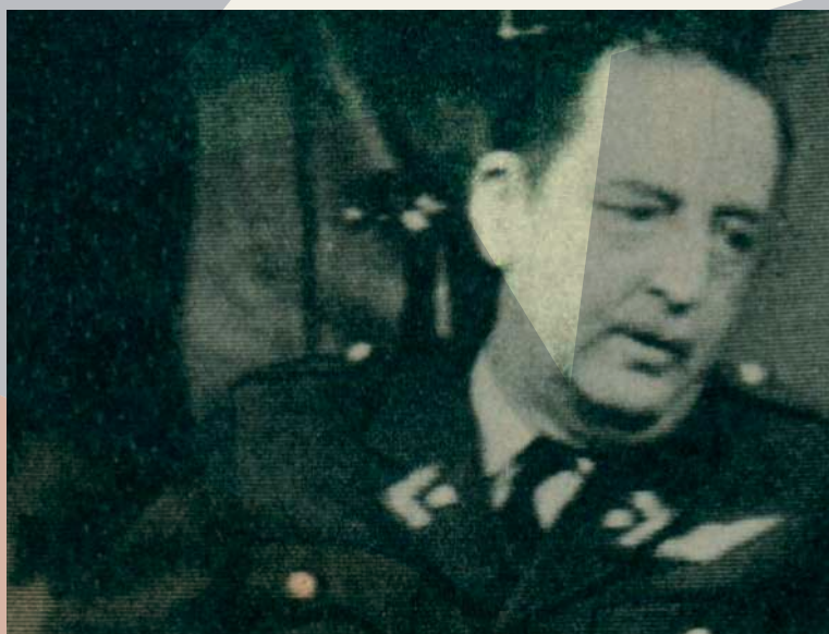
General del Aire César Ruiz Danyau 1° Rector Militar del 3 octubre 1973 al 24 julio 1974

Sin embargo, la intervención institucional del oficialismo de la época no fue ejercida solamente por militares, hubo muchos civiles que actuaron alineados con el accionar de las fuerzas armadas en el poder. Entre ellos, dueños de medios de comunicación que apoyaron el golpe militar fueron civiles que colaboraron en la instauración permanente de la censura. Conocidos son los casos de la revista Análisis o el diario Fortín Mapocho.