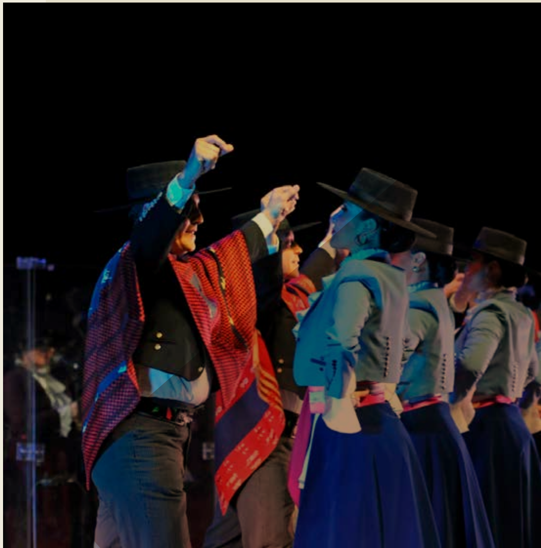
Homogeneidad y uniformidad de cuerpos disciplinados