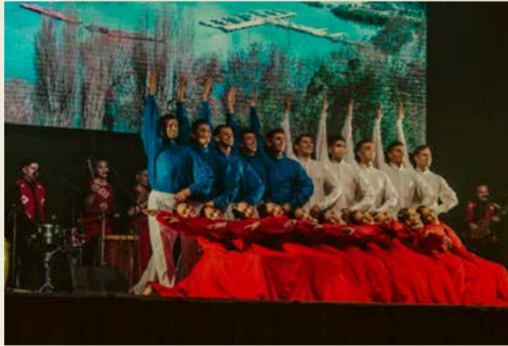
Uniformidad y nacionalismo en el Ballet folklórico

Según Michel Foucault (2002), el discurso vinculado al poder y al deseo está afectado por los procedimientos de exclusión, de manera de ejercer control sobre el peligro y el poder de la producción de discurso. La disciplina, según Foucault, es un principio de control de la producción de discurso. Las disciplinas son un principio de limitación, definidas como un conjunto de métodos, un corpus de proposiciones consideradas verdaderas, un juego de reglas y definiciones, de técnicas e instrumentos.