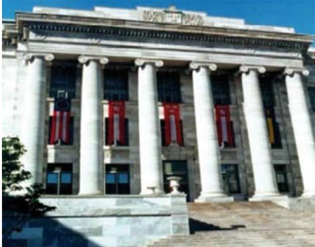
Escuela de Medicina, Universidad de Harvard, USA. ( http://hr.hms.harvard.edu ).