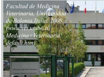
Facultad de Medicina Veterinaria, Universidad de Bologna, Italia, 2008. ( www.vet.unibo.it/Medicina+Veterinaria/default.htm ).

¿Todos los académicos de nuestra Universidad poseen un grado académico? Probablemente sí. Pero probablemente no todos estén en posesión del grado de Magíster o de Doctor, pues esta es una exigencia que con el avance del tiempo se ha ido materializando, exi-